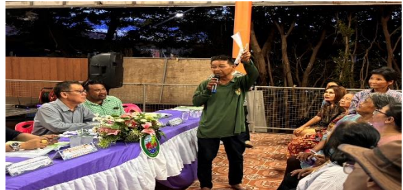
หมู่ที่ ๑๑ บ้านโพธิ์ ตำบลคูบัว อำเภอเมืองราชบุรี จังหวัดราชบุรี วันศุกร์ที่ ๘ พฤษภาคม ๒๕๖๙ ณ ศาลาวัดบ้านโพธิ์ หมู่ที่ ๑๑