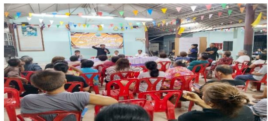
หมู่ที่ ๑๐ บ้านท่าช้าง ตำบลคูบัว อำเภอเมืองราชบุรี จังหวัดราชบุรี วันพฤหัสบดีที่ ๗ พฤษภาคม ๒๕๖๙ ณ ศาลาอเนกประสงค์หมู่บ้าน หมู่ที่ ๑๐