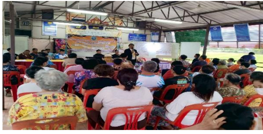
หมู่ที่ ๔ บ้านใต้ ตำบลคูบัว อำเภอเมืองราชบุรี จังหวัดราชบุรี วันอังคารที่ ๒๘ เมษายน ๒๕๖๙ ณ ศาลาอเนกประสงค์หมู่บ้าน หมู่ที่ ๔