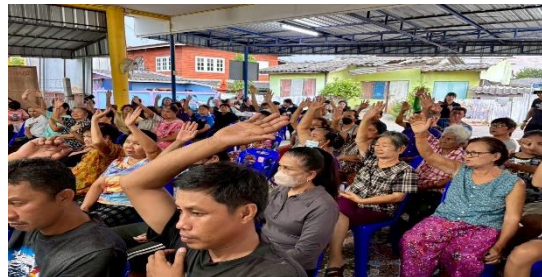
หมู่ที่ ๕ บ้านตะโก ตำบลคูบัว อำเภอเมืองราชบุรี จังหวัดราชบุรี วันพุธที่ ๒๙ เมษายน ๒๕๖๙ ณ ศาลาอเนกประสงค์หมู่บ้าน หมู่ที่ ๕