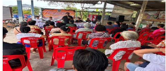
หมู่ที่ ๑๓ บ้านต้นแห่น ตำบลคูบัว อำเภอเมืองราชบุรี จังหวัดราชบุรี วันอังคารที่ ๑๒ พฤษภาคม ๒๕๖๙ ณ ศาลาอเนกประสงค์หมู่บ้าน หมู่ที่ ๑๓