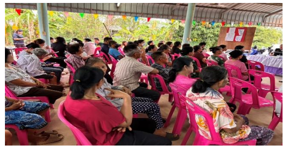
หมู่ที่ ๑๔ บ้านนวมพุดอ ตำบลคูบัว อำเภอเมืองราชบุรี จังหวัดราชบุรี วันพฤหัสบดีที่ ๑๔ พฤษภาคม ๒๕๖๙ ณ อาคารอเนกประสงค์หมู่บ้าน หมู่ที่ ๑๔